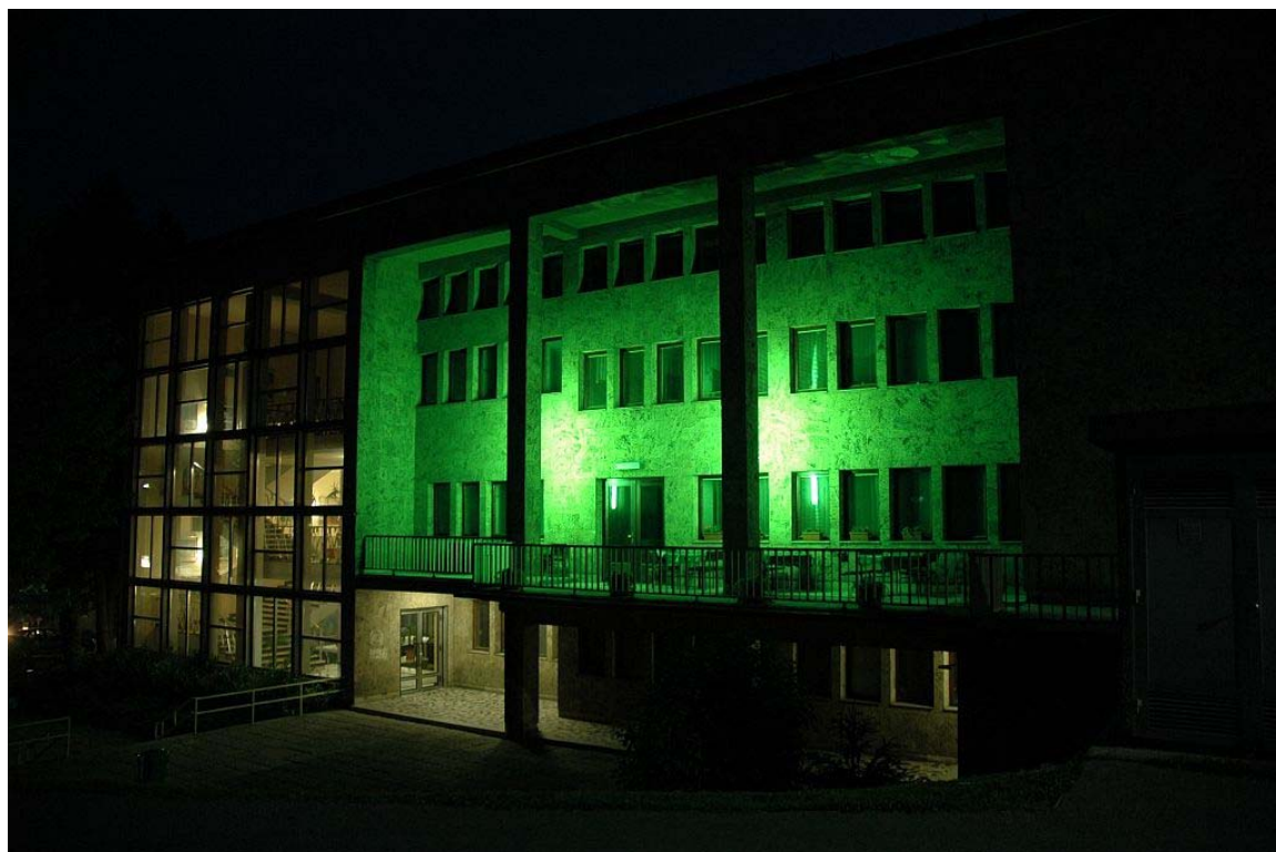
Na fotografiji: KC DD Zagorje by night