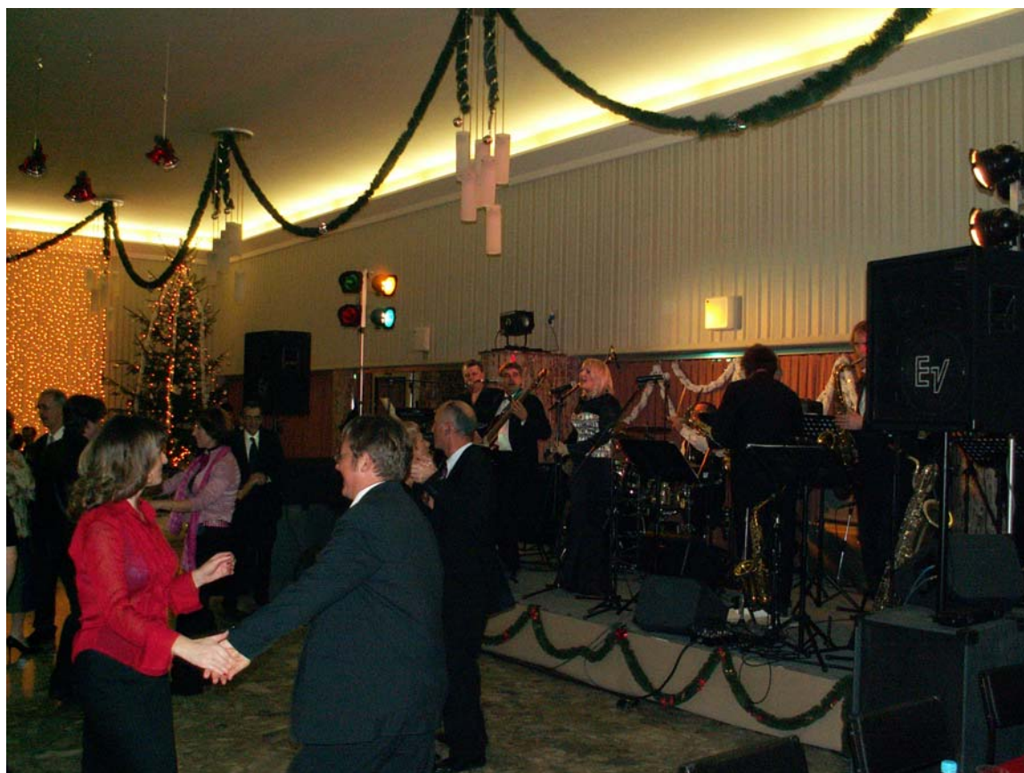
Na fotografiji je utrinek iz silvestrovanja: 31.12.2005

KULTURNI CENTER DELAVSKI DOM ZAGORJE ( www.kulturnidom-zagorje.si , v nadaljevanju KC DD Zagorje) je ugledna slovenska kulturna ustanova, ki že od leta 1960 razsvetljuje svoje goste. Predstave, ki gostujejo pri njih, so tako privlačne, da so nemalokrat razprodane, četudi premore njihova Velika dvorana udobno namestitev za kar 468 gostov. Poleg te imajo v KC DD Zagorje še Stekleno dvorano z velikim plesiščem, ki jo pogosto napolnijo najprej z magičnimi zvoki, nato pa še s čarobnimi gibi svojih gostov. Ker je Velika dvorana večnamenska, ustreza kriterijem kinematografa. Veliko obiskovalcev privabijo tudi vse pogostejše razstave in koncerti. O pestrem dogajanju in prireditvah goste obveščajo v vseh medijih; tiskanih zloženkah, E-pošti in s sprotnim osveževanjem spletišča: vroče ta hip .