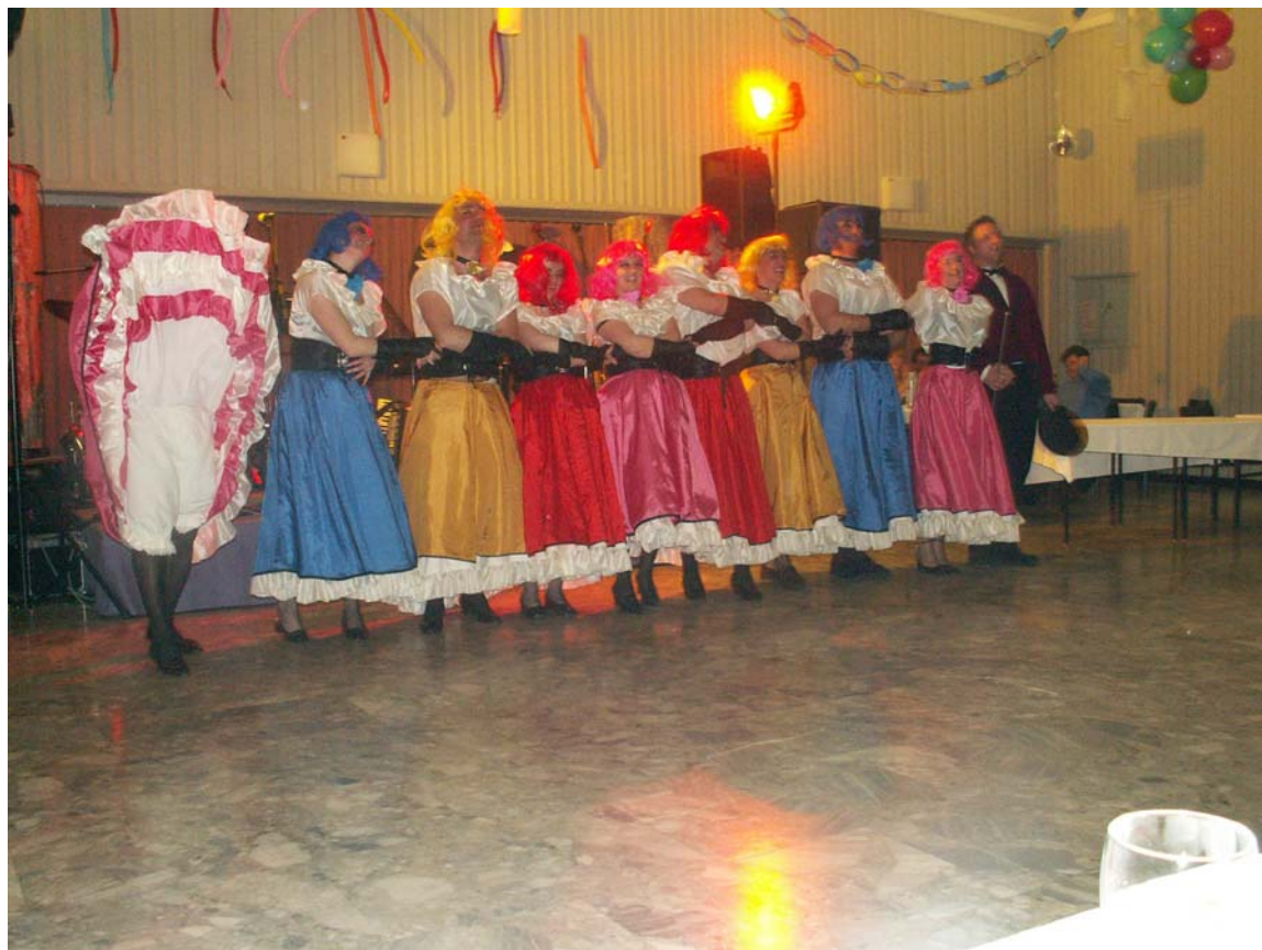
To veselo pustno rajanje 2006