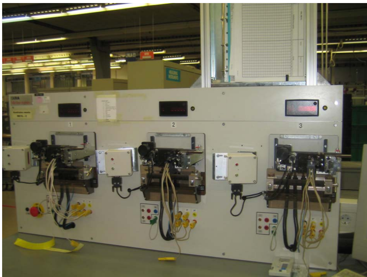
3 kontrolne točke v proizvodnji s tremi OEM-čitalniki Metrologic

LEOSS lahko zagotovi kompletno programsko in strojno opremo za spremljanje in sledenje v različnih izvedbenih fazah proizvodnje . Poleg tega je LEOSS razvil tudi opremo za vodenje celotnih skladišč, podporo logističnim centrom in preprostim vele- in maloprodajnim podjetjem, vključno s podporo sledljivosti artiklov. Več o naši ponudbi si preberite na http://www.leoss.si , lahko pa nas pokličete na telefonsko številko 01 530 90 20 ali GSM 040 480 004 oziroma pošljete E-pošto na leoss@leoss.si .