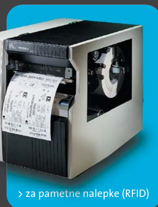
> za pametne nalepke (RFID)